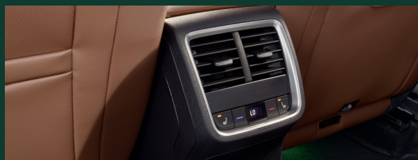
Climatronic automatyczna 3-strefowa klimatyzacja z regulacją elektroniczną