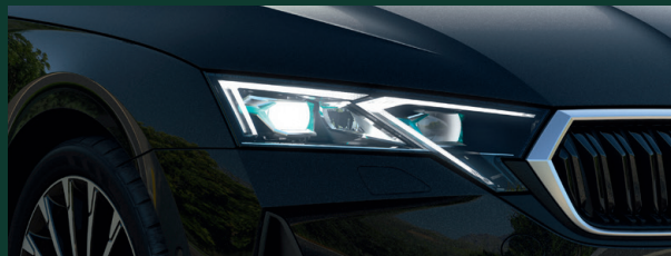
Oświetlenie LED - reflektory TOP LED Matrix