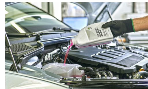
Pakiet przeglądów: 2 wymiany oleju + 2 przeglądy okresowe (bez wymiany oleju)