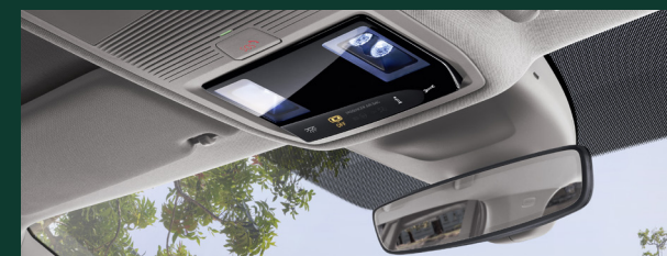
Port USB-C - umieszczony w lusterku wewnętrznym samochodu