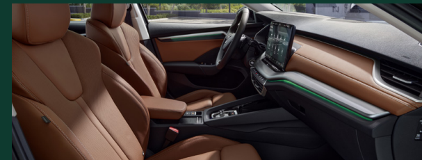
Komfort podróży - ergonomiczne siedzenia z certyfikatem AGR