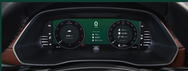
Virtual Cockpit - cyfrowy zestaw wskaźników