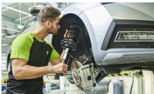
Pakiet przeglądów: 1 wymiana oleju + 1 przegląd okresowy (bez wymiany oleju)

W ramach Pakietów Przeglądów otrzymujesz opłacone przeglądy okresowe (robocizna, oryginalne części i materiały eksploatacyjne, zgodnie z planem serwisowym).