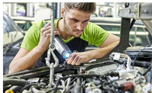
Pakiet przeglądów: 2 wymiany oleju + 1 przegląd okresowy (bez wymiany oleju)