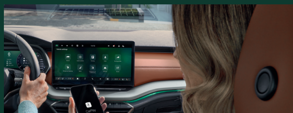
Funkcja SmartLink - połączenie przewodowe/ bezprzewodowe dla urządzeń Apple iOS*