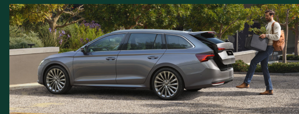
Bezdotykowe otwieranie i zamykanie elektronicznie sterowanej pokrywy bagażnika