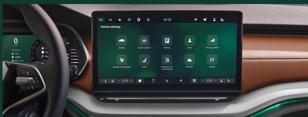
Wyświetlacz Infotainment 13" z nawigacją