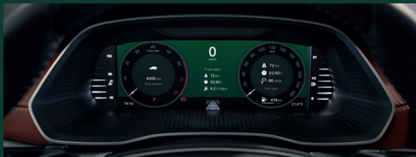
Virtual Cockpit - cyfrowy zestaw wskaźników