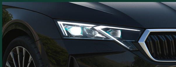
Oświetlenie LED - reflektory TOP LED Matrix