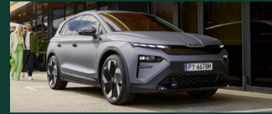
Oświetlenie LED Matrix zwiększające bezpieczeństwo na drodze