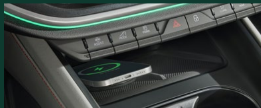
Phone Box Qi2 (magnetyczne ładowanie bezprzewodowe) 1