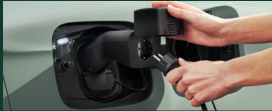
Zasilanie urządzeń zewnętrznych – BiDi DC/AC (V2L)