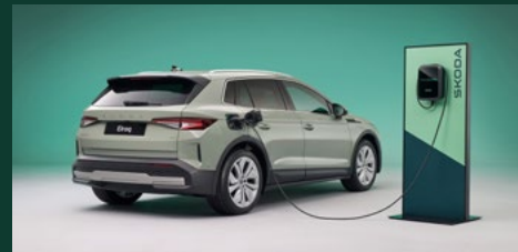
Zasięg do 576 km na jednym ładowaniu 3