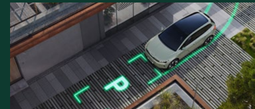
Intelligent Park Assist, Remote Park Assist, Trained Parking