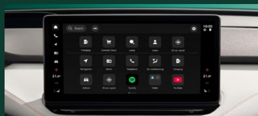
Nowoczesny system Infotainment i intuicyjna łączność Ekran 13" wraz z bezprzewodowym Smartlink w standardzie 5