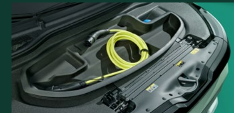
Frunk - mały bagażnik pod maską