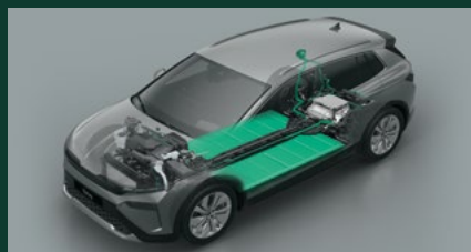
Maksymalna moc silnika do 340 KM 2 Przyspieszenie 0-100 km nawet 5,4 s