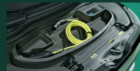
Frunk - mały bagażnik pod maską