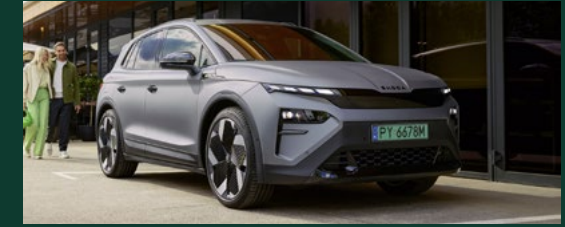
Oświetlenie LED Matrix zwiększające bezpieczeństwo na drodze