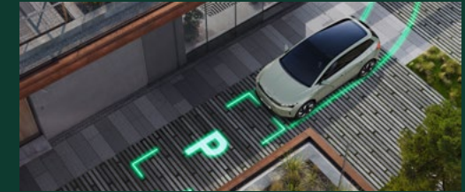
Intelligent Park Assist, Remote Park Assist, Trained Parking