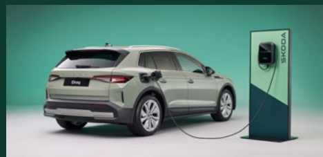
Zasięg do 576 km na jednym ładowaniu 3