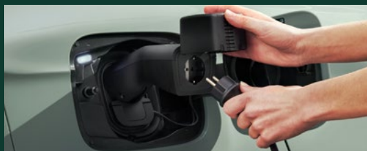
Zasilanie urządzeń zewnętrznych – BiDi DC/AC (V2L)