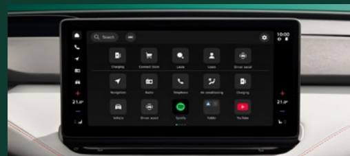
Nowoczesny system Infotainment i intuicyjna łączność Ekran 13" wraz z bezprzewodowym Smartlink w standardzie 5