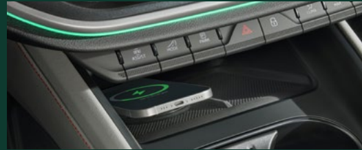
Phone Box Qi2 (magnetyczne ładowanie bezprzewodowe) 1