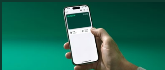
Digital Key - cyfrowy kluczyk 4