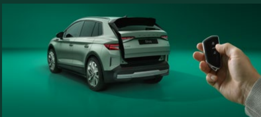
Kessy Full z funkcją Walk Away Locking