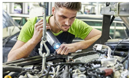
Pakiet przeglądów: 2 wymiany oleju + 1 przegląd okresowy (bez wymiany oleju)