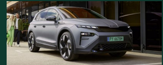
Oświetlenie LED Matrix zwiększające bezpieczeństwo na drodze