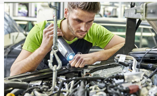
Pakiet przeglądów: 2 wymiany oleju + 1 przegląd okresowy (bez wymiany oleju)