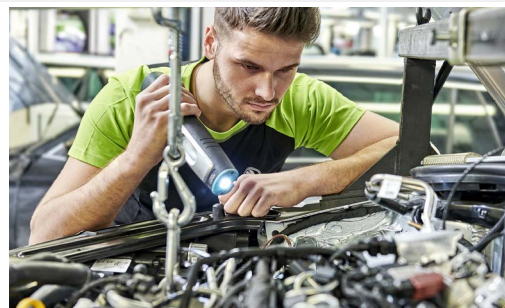
Pakiet przeglądów: 2 wymiany oleju + 1 przegląd okresowy (bez wymiany oleju)