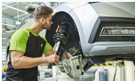
Pakiet przeglądów: 1 wymiana oleju + 1 przegląd okresowy (bez wymiany oleju)

W ramach Pakietów Przeglądów otrzymujesz opłacone przeglądy okresowe (robocizna, oryginalne części i materiały eksploatacyjne, zgodnie z planem serwisowym).